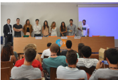
Acto de bienvenida del Master in Global Entrepreneurial Management (MGEM) el pasado mes de septiembre. Foto de archivo [clicar para mayor resolución]