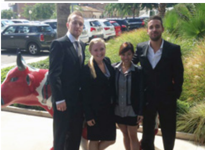
Grupo de alumnos del MGEM que han realizado su trabajo de consultoría en Coca-Cola Bottling Company, SL [clicar para ampliar la imagen]

PERSONA CIENCIA EMPRESA Universitat Ramon Llull